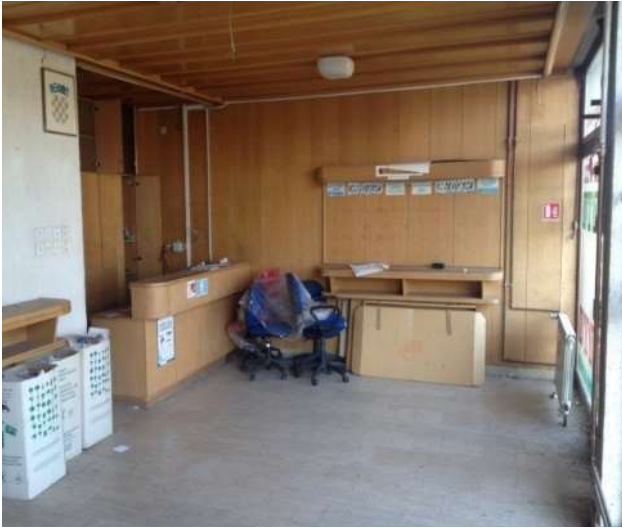
Foto-dokumentirano je stanje nekretnine na dan 18.11.2015.g.